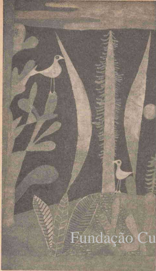
PAUL KLEE — Paisagem com pássaros amarelos — 1923