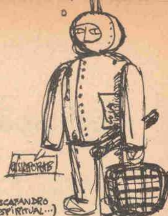
(O ESCAPANDO É ESPIRITUAL...)