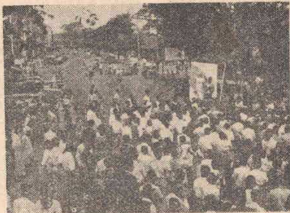
Aquí... sólo técnicas de masas...

Ahora bien, «la Acción Católica es una entidad misional: su objeto es suscitar una presencia viviente, resplandeciente, auténtica, de la Iglesia en un ambiente determinado (como ser la Universidad), para que se desarrollen así todas las promesas de vida religiosa que se encuentran en germen en dicho ambiente». (Hasseveldt, «El Misterio de la Iglesia»).