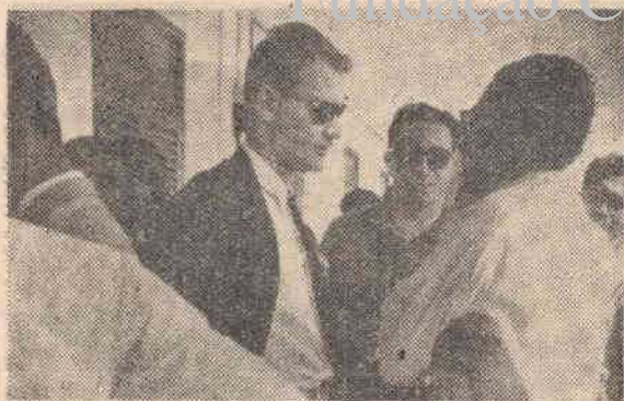
Vida universitaria... estado de misión

Los centros universitarios que, siglos atrás, fueron núcleos de formación cristiana de las generaciones, son hoy, en numerosísimos casos, canales de laicización y apostasía práctica.