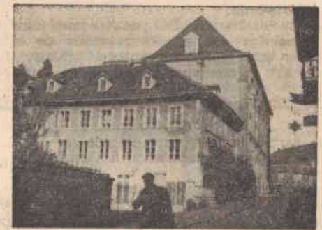
Le bâtiment des bureaux de Pax Romana

Enfin, certaines fédérations ont fait un très grand effort pour augmenter le nombre des membres de l'Association des Amis de Pax Romana. En novembre 1952, le Secrétariat général avait lancé, en vue de trouver