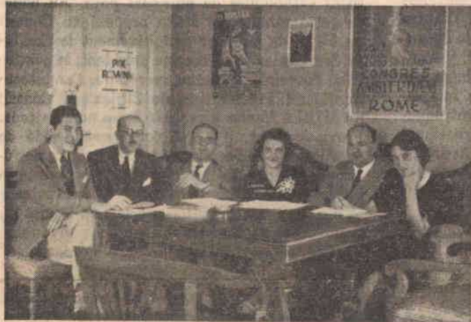
Le Secrétariat Général se présente :