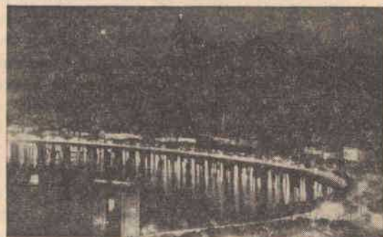
La statue illuminée du Christ-Roi, domine le rade de Rio de Janeiro

Au cours de cette réunion régionale, un plan d'action ibéro-américain de Pax Romana -MIEC a été élaboré. En douze points, ce plan essayait d'ordonner d'une manière plus effective, quoique dans la modestie de tous les débuts, le développement de la communauté de Pax Romana en Amérique Latine. Ses étapes principales étaient: la constitution d'une équipe supra-nationale pour coordonner les activités, l'élaboration d'un fichier des dirigeants, la publication à Assomption (Paraguay) d'un bulletin d'information et le projet de quelques réunions régionales, avec