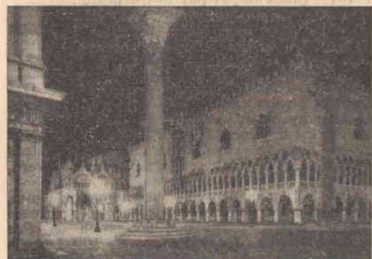
Place Saint-Marc, Venise

Depuis les réunions du Canada, les dirigeants de Pax Romana -MIIC ne se sont rencontrés de nouveau qu'à Venise, au mois de mai 1953. Le Conseil du MIIC a tenu alors sa XIV e session, en marge de la Rencontre d'études sur les problèmes de la population. Ce fut une réunion brève mais intense, qui a permis de passer en revue toutes les questions