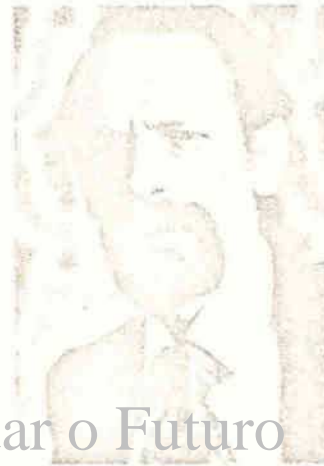
Lopes Cardoso Não aos «revolucionários» para testar votos socialistas

o beneplácito — não activo — do próprio Otelo.