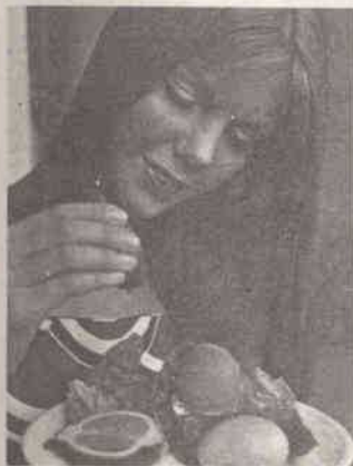
Algumas verdades sobre os ovos pág. 31

SEGUNDA QUINZENA • JUNHO 1975 • N.º 264 • ANO 14.º