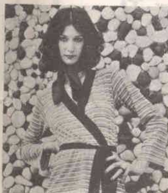
Moda em férias pág. 69