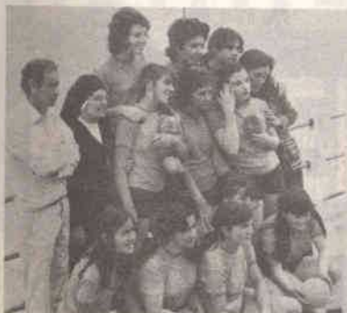
Andebol Desporto no feminino pág. 37