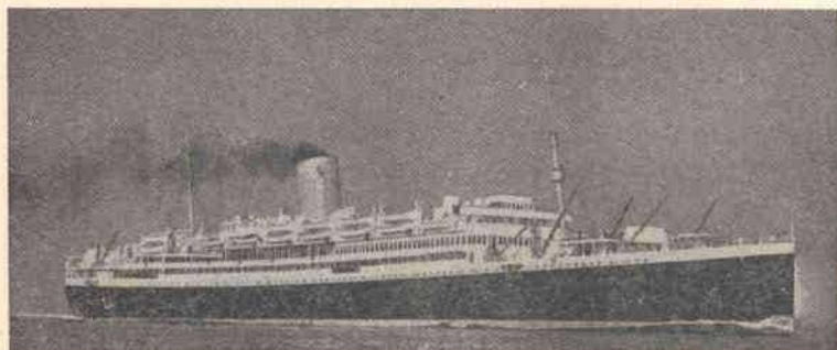
○ paquete "Alcantara" da Mela Real Inglesa