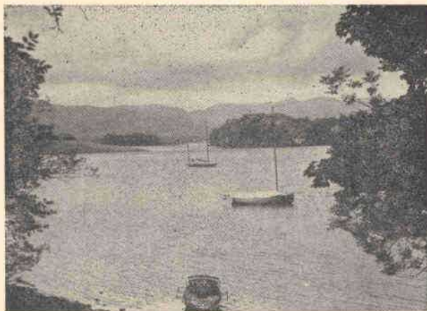
Panorama da Região dos Lagos