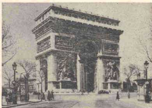
PARIS — O Arco do Triunfo

Os participantes deverão entregar-nos até ao dia 1 de Maio , o passaporte válido para a Inglaterra, França e Espanha , contendo os vistos Consulares da França e Espanha. A nossa Secção de Passaportes pode, a pedido, encarregar-se da obtenção destes documentos.