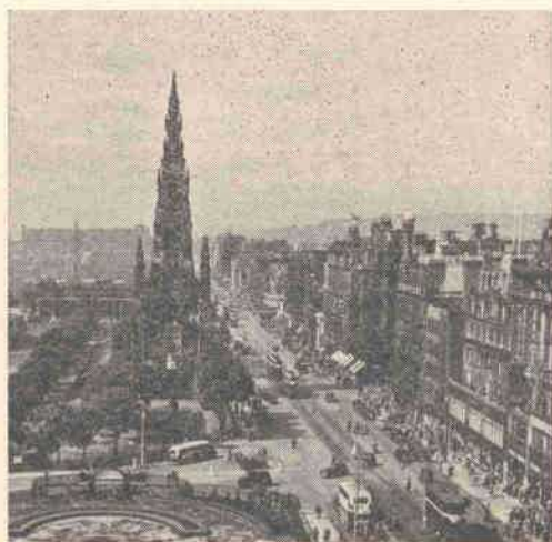
EDINBURGH — A Rua dos Príncipes

22 DE MAIO — Partida de manhã cedo para a excursão através da famosa região dos Lagos, visitando Derwentwater, Bassenthwaite, Crummock Water, Coniston Water e Thirlmere — almoço em trânsito — regresso a Grange-Over-Sands para jantar e dormir.