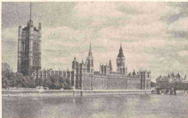
LONDRES — O Parlamento