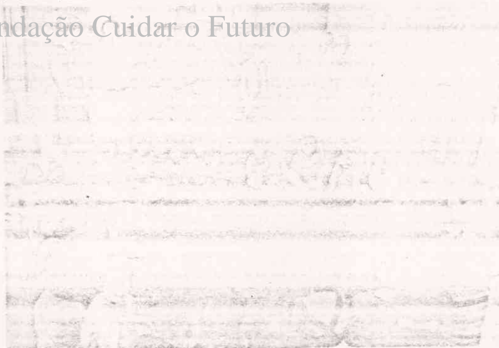
Rodeada de crianças, no Centro Social do Barredo, a primeira-ministro fez um pequeno intervirio na luta com a multidão.