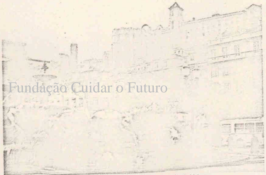
Cinq ans après, toujours des œillets sur les trottoirs de Lisbonne.

de Paredes de Coura, j'ai vu le visage de Mme Pintasilgo se figer lorsqu'une infirmière l'a entraînée dans une salle où des malades reposaient entre des murs sales, noircis par la moisissure. Impuissante devant la situation dramatique, elle écoutait les plaintes et les revendications du personnel, puis discutait avec les infirmières et un jeune médecin. Compte tenu qu'un nouvel hôpital ne verra pas le jour avant plusieurs années, et compte tenu de la pauvreté du pays, faut-il entreprendre, dès maintenant, des travaux dans l'ancien établissement ? Débat sérieux et digne entre gens responsables qui s'écoutaient, se respectaient, se faisaient confiance.