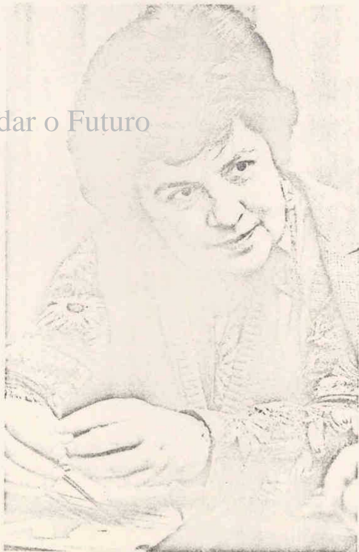
Maria de Lourdes Pintasilgo, 49 ans. Solidement axée sur l'Évangile.

« Il y a quelques semaines, dans un village de pêcheurs, une femme m'a dit : « J'ai dix enfants. Mon mari gagne 6 000 escudos par mois (environ 510 F). C'est très dur... ». Puis, elle s'est brusquement interrompue et a ajouté : « Mais vous devez avoir une foule d'autres problèmes à résoudre.