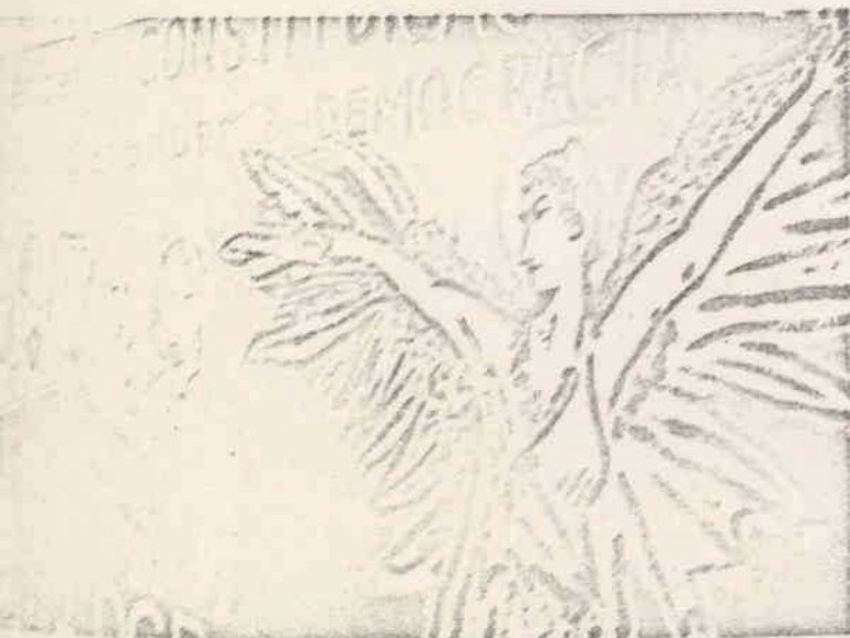
« Affiche » du parti communiste. Des artistes ont réalisé ces fresques.

« Tout projet dit « de gauche » qui n'inclut pas une volonté de libération de la femme est un projet mutilé, amputé d'une dimension fondamentale. Il y a soixante ans, la volonté collective des travailleurs de changer leur condition a constitué une nouvelle force sociale ; de même aujourd'hui, l'intervention, dans la vie publique des femmes, c'est-à-dire de la moitié de l'humanité, peut