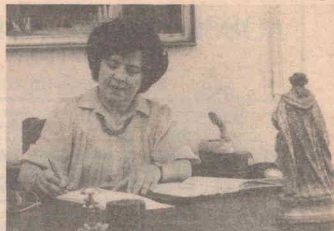
Maria de Lourdes Pintasilgo Um prestigioso cargo na UNESCO

A Universidade das Nações Unidas é um espaço crítico aberto aos mais diversificados campos do saber e da investigação mundial. Segundo dados recentes, integram este projecto 120 unidades de pesquisa científica pertencentes a 60 paí-